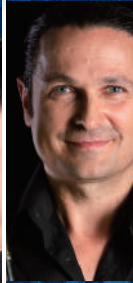
ワルター・フオーグルマイヤー (トロンボーン)