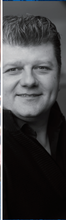
ラデク・バボラーク (ホルン)