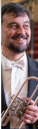
ライナー・キューブルベック (トランペット)