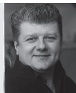
ラデク・バボラーク (ホルン) Radek Baborák, Horn

チェコ・フィル、ミュンヘン・フィル、バンベルク響、ベルリン・フィルの首席を歴任し、現在、西ボヘミア交響楽団首席指揮者、チェコ・シンフォニエッタ芸術監督。